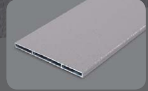
RAL 9006 FS

Sonderprofile ermöglichen die Aufnahme von 8mm Materialien wie Glas, Trespar® oder ähnliches.