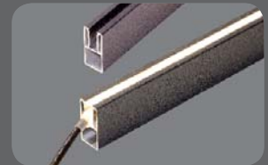
Leistenprofil 45 m. LED-Streifen