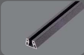
Nutfüllprofil, RAL 7016 FS + 9006 FS

Sonderprofile ermöglichen die Aufnahme von 8mm Materialien wie Glas, Trespar® oder ähnliches.