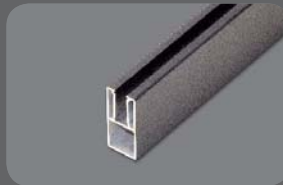
Leistenprofil 45 RAL 7016 FS + 9006 FS