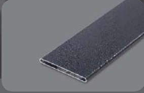
Federprofil 88x8mm, RAL 7016 FS