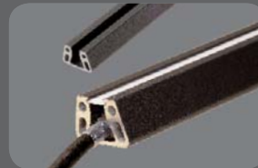
Nutfüllprofil m. LED-Streifen