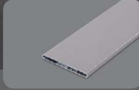
RAL 9006 FS