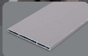
RAL 9006 FS

Sonderprofile ermöglichen die Aufnahme von 8mm Materialien wie Glas, Trespar® oder ähnliches.