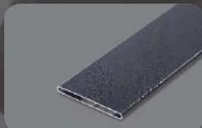
Federprofil 88x8mm, RAL 7016 FS