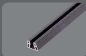
Nutfüllprofil, RAL 7016 FS + 9006 FS

Sonderprofile ermöglichen die Aufnahme von 8mm Materialien wie Glas, Trespar® oder ähnliches.