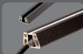
Nutfüllprofil m. LED-Streifen